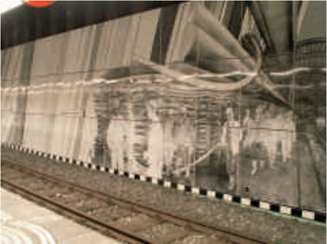
Beispiel: Stadtbahn-Bahnhof Bergwerk Consolidation in Gelsenkirchen. Gestaltung von Alfred Schmidt

U-Bahnhöfe, wie z. B. die Station „Trinenkamp“ und „Bergwerk Consolidation“ in Gelsenkirchen sind von Künstlern mit Bergbau-Motiven ausgestaltet.