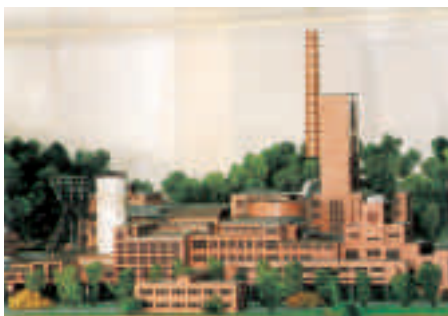
Modell der Schachtanlage Carl Funke

Der Bergbau an der Ruhr im Bereich des Ortsteils Heisingen wird mit Dokumenten, Bildern und Exponaten dargestellt.