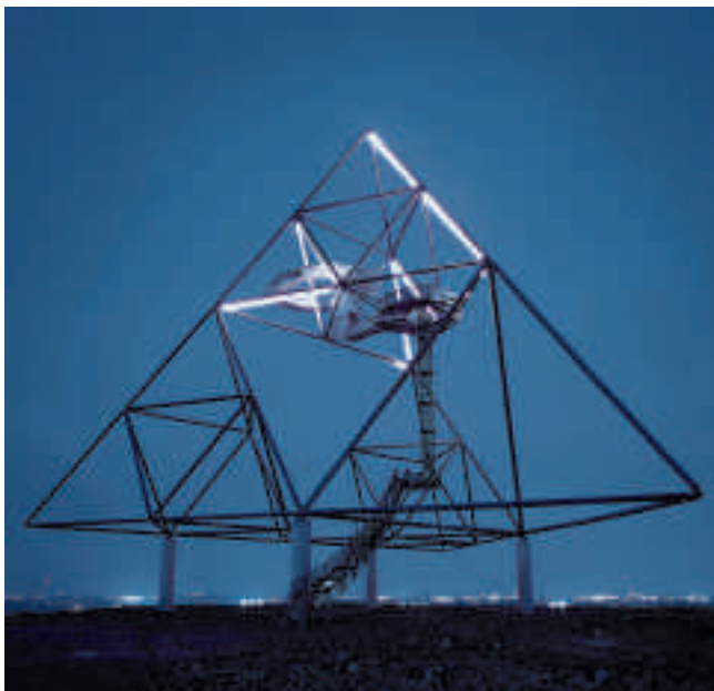
Das Tetraeder in Bottrop

Die Region beherbergt eine Vielzahl von montanhistorischen Stätten sowie kleine und große Museen. Die bedeutendsten Objekte werden in der Route der Industriekultur (s. 2.0) verbunden. Auf Spaziergängen kann man viel über das Revier erfahren. Einen guten Überblick gewinnt man von ehemaligen Bergehalden, die zu Landschaftsbauwerken gestaltet sind. Hier, auf der Halde Beckstraße in Bottrop bietet einem das Tetraeder einen Blick von noch höherer Warte: