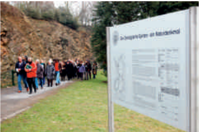
Geologischer Garten Bochum

Der Geologische Garten Bochum – seit 1974 erstes Naturdenkmal seiner Art in Deutschland – im Ziegelei-Steinbruch der ehem. Zeche Friederika gelegen, zeigt deutlich sichtbare geologische Strukturen und Gesteine der Kreide und des Karbons des Ruhrgebiets. Ein Exkursionsführer kann im Internet ( www.bochum.de/umweltamt → Aktuelles → Themen → Geol. Garten) heruntergeladen werden bzw. ist beim Umwelt- und Grünflächenamt erhältlich.