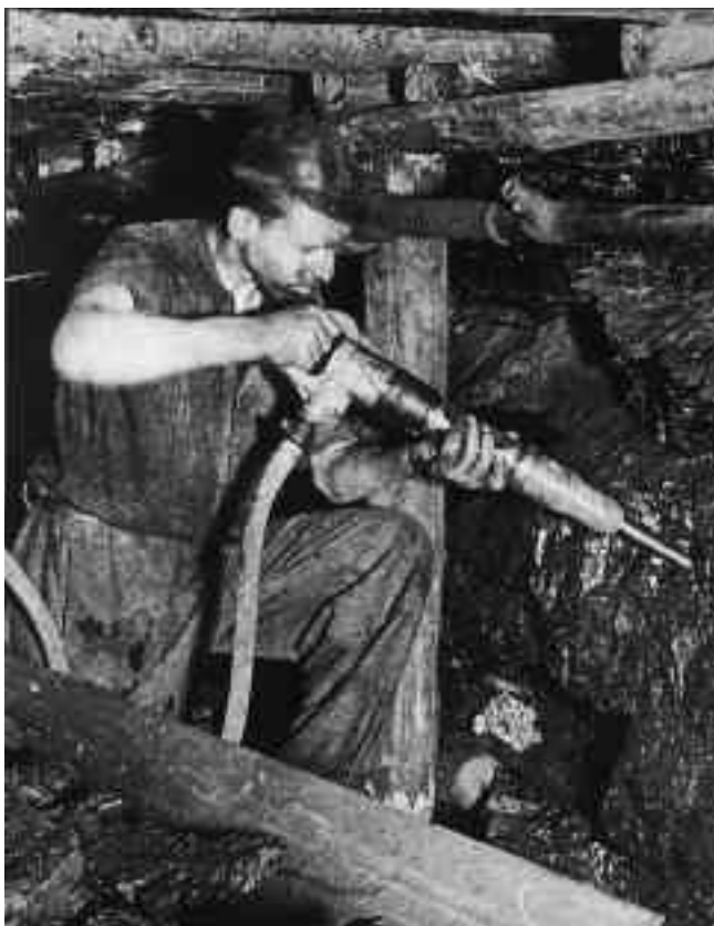
Bergmann um 1950

Das größte deutsche Bergbau-Archiv wurde 1969 gegründet und ist beim Deutschen Bergbau-Museum Bochum angesiedelt. Träger des Archivs sind die DMT-Gesellschaft für Lehre und Bildung, der Gesamtverband des deutschen Steinkohlenbergbaus und die Wirtschaftsvereinigung Bergbau. Mit über 220 Beständen und 30 Sammlungen ist es das Zentralarchiv des Bergbaus. Unter den Aktenbeständen vornehmlich des Steinkohlen- und Erzbergbaus nehmen die des Ruhrbergbaus einen zentralen Platz ein.