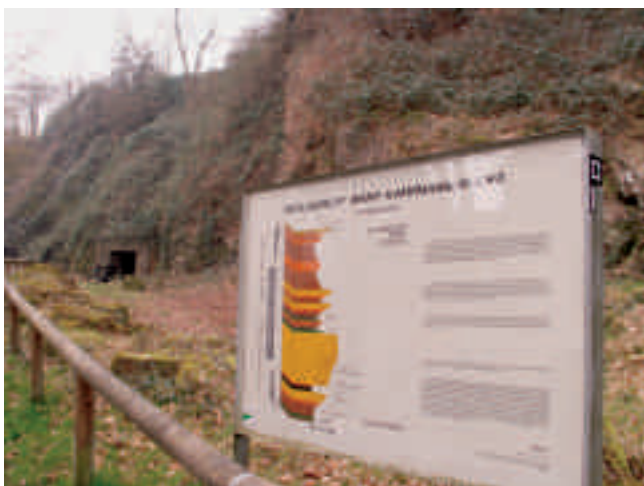
Geologischer Aufschluss Kampmannbrücke in Essen