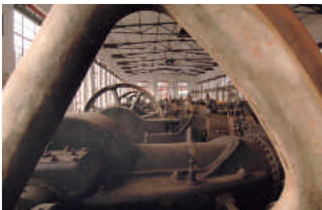
Kompressorenhalle der Kokerei Hansa