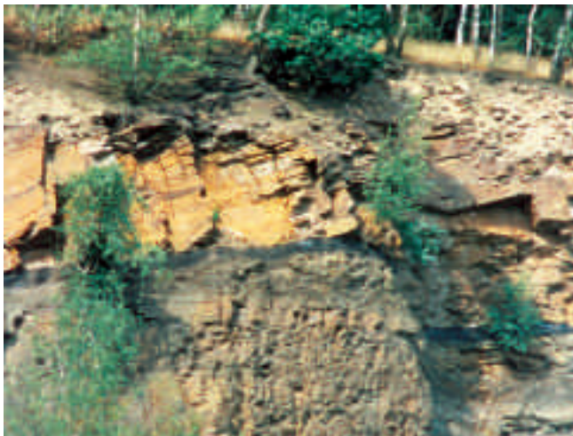
Kohlenflöz in einem Steinbruch

Mit über 30 Standorten gehört der Bergbaurundweg Muttental in Witten an der Ruhr zu den größten seiner Art. Geologische Aufschlüsse, Stollenmundlöcher, Rekonstruktionen von Zechegebäuden und Schachtgerüsten, der Besucherstollen Nachtigall (s. 2.20.2)