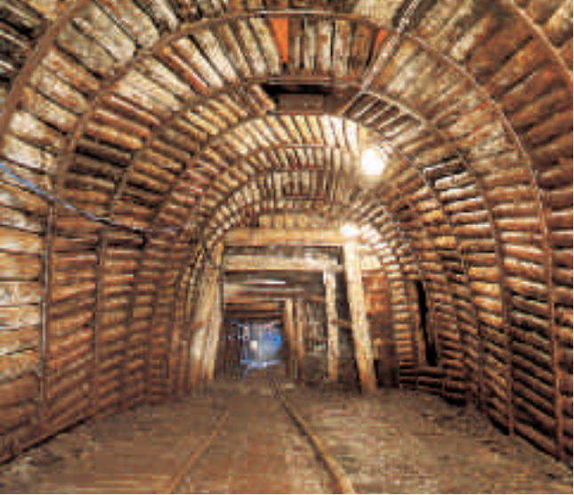
Strecke mit Holzbausbau