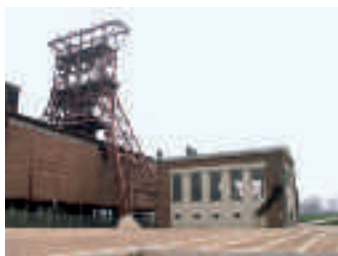
Maschinenhaus und Schacht- gerüst Zeche Consolidation