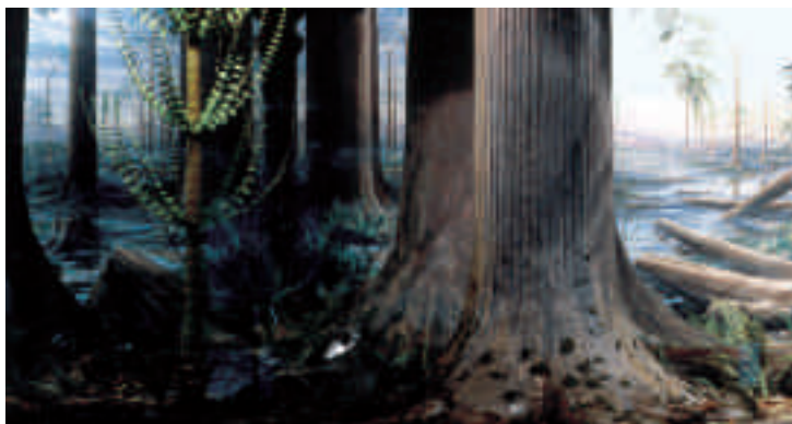
Steinkohlenwald im Karbon (Diorama, Ruhr Museum, Essen)