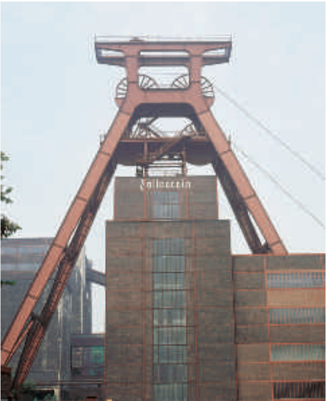
Zeche Zollverein (Budde, RVR)