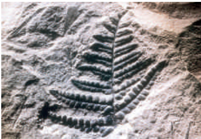
Farnabdruck aus dem Karbon

Die renomierten Karbon-Sammlungen des Saarbergbaus sind in das neue Zentrum für Biodokumentation in Trägerschaft des saarländischen Ministeriums für Umwelt auf dem Gelände des ehem. Bergwerks Reden integriert worden.