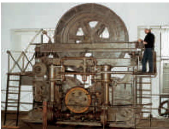
Der voll funktionsfähige Dampfhaspel von 1894.

Das Werksmuseum hat seinen Standort in der ehemaligen Turbinenhalle eines stillgelegten Zechenkraftwerks. Maschinen, Geräte und Dokumente aus mehreren Jahrhunderten regionaler Bergbaugeschichte spiegeln die Arbeitswelt des Ibbenbürener Bergmannes im Wandel der Zeit wider. Mineralien und Fossilien, Anthrazit und historische Öfen, Bilder und Skulpturen sowie eine Turbogeneratoreinheit des alten Kraftwerks, die auf dem Platz ihres aktiven Arbeitseinsatzes belassen wurde, runden die Präsentation ab. Der Ibbenbürener Dampfhaspel – einzig erhaltener Zeitzeuge seiner Art aus der Epoche der Dampfmaschinen im Bergbau – wird bei Führungen in Betrieb genommen.